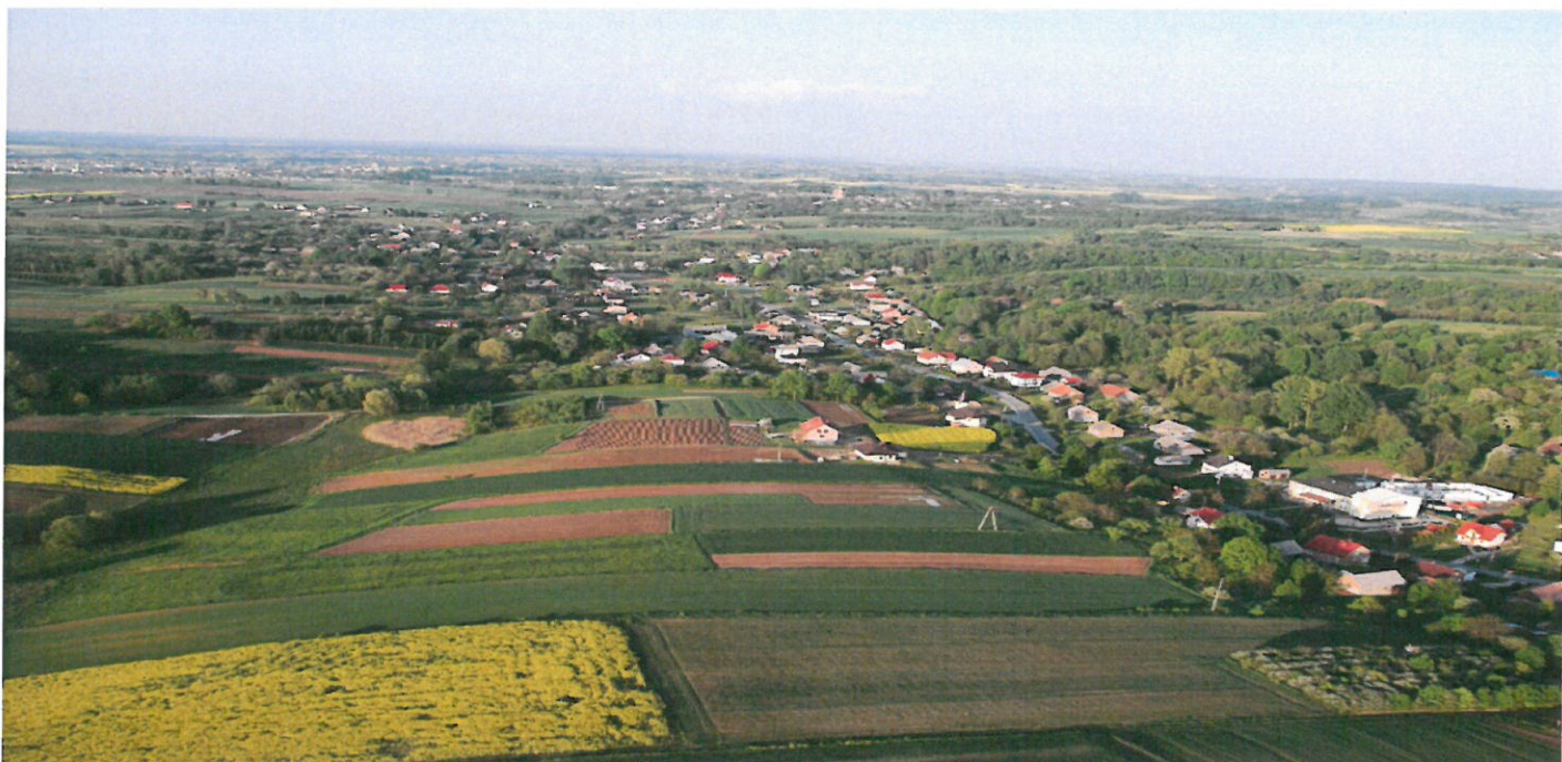
Panorama sołectwa Gnojnica Dolna