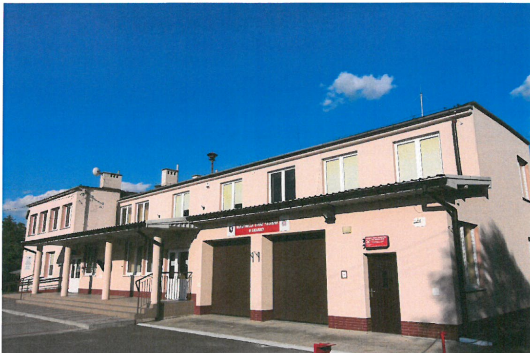
Budynek Wiejskiego Centrum Kultury oraz Remizy OSP