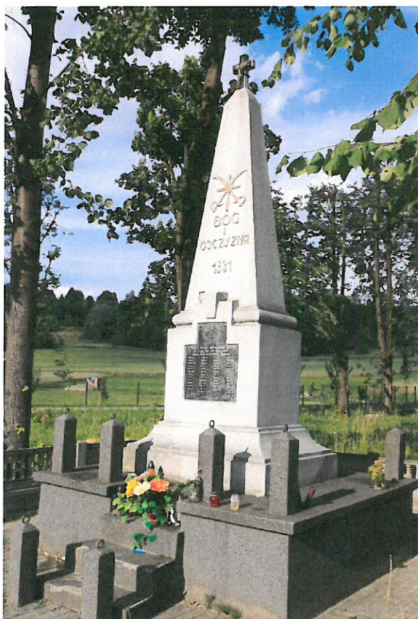
Pomnik- obelisk wystawiony w 1931 r. na „Małym Błoniu”