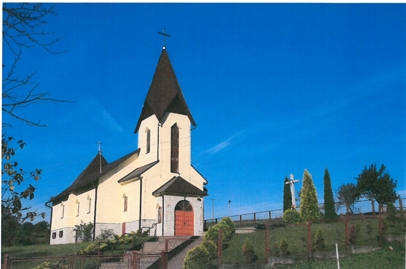
Kaplica pw. Św. Wojciecha w Gnojnicy Dolnej